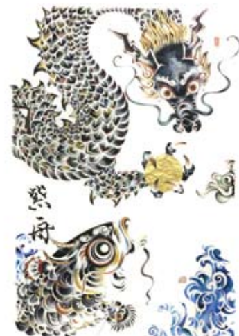
「行かざれば至らず。龍の如く。 為さざれば成らず。鯉の如く。」