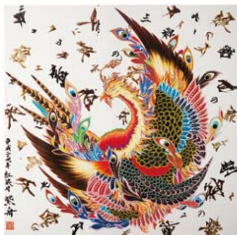
天皇皇后両陛下御覧作品 「火の鳥」H1800×W1800×D35mm