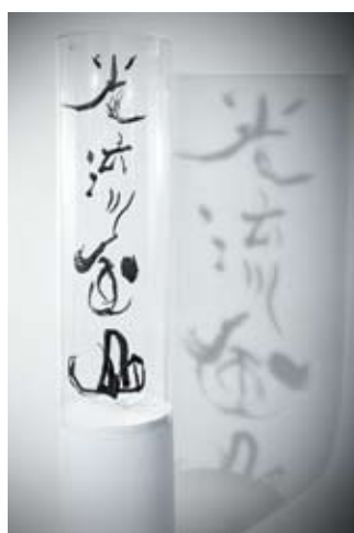
天皇皇后両陛下御覧作品 「光流風山」H1300×W400×D400mm